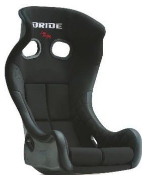
FRPシルバーシェル ブラック