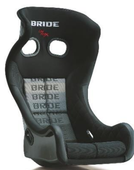
スーパーアラミドシェル グラデーションロゴ