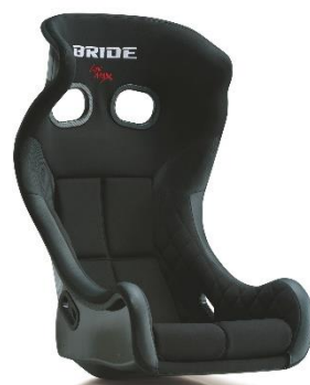
スーパーアラミドシェル ブラック