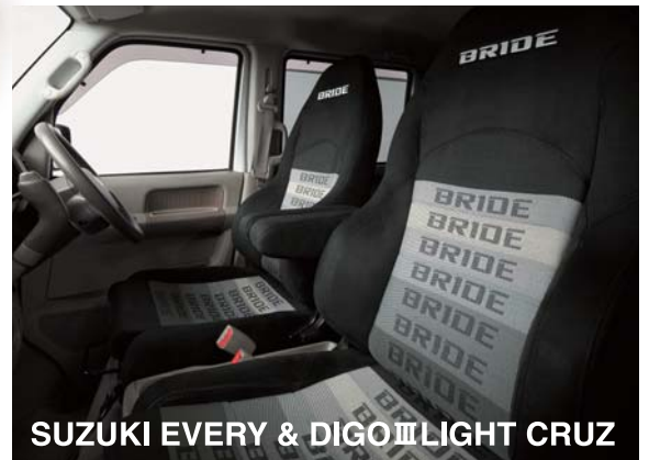
SUZUKI EVERY & DIGOⅢLIGHT CRUZ

ブリッド株式会社(愛知県東海市、代表取締役社長:高瀬嶺生)は、自社ブランドBRIDE(ブリッド)の自動車専用シートを車両へ取り付けする際に必要な車種別シートレール製品「スズキ・エブリイ用LYタイプ」を11月14日より発売いたします。本製品は、エブリイの純正シートを取り外し、当社製リクライニングシートの取り付けに必要なシートレールをLYタイプとして新開発したものです。本製品は全国のBRIDE取扱店にてご注文いただけます。