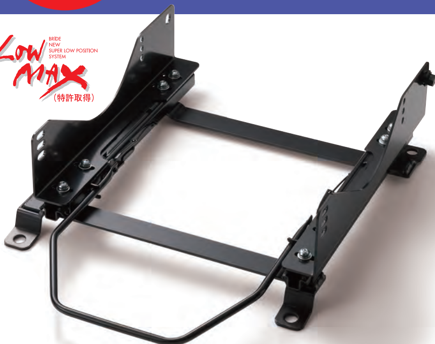
スーパーシートレールLFタイプ 86、BRZ右席用

LOW MAX BRIDE NEW SUPER LOW POSITION SYSTEM (特許取得)