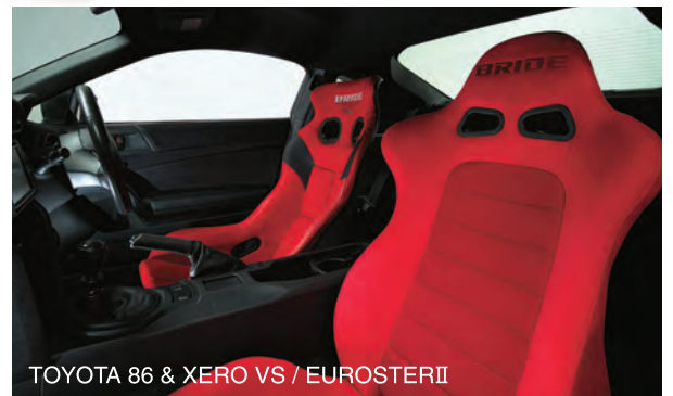
TOYOTA 86 & XERO VS / EUROSTERII

写真は、トヨタ・86の運転席にXERO VS・FRP製シルバーシェル・レッド(H03BMF)を、助手席にEUROSTERII・レッドBE(E32BBN)を装着したものです。