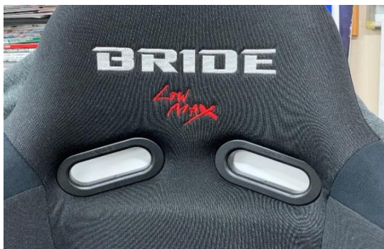
従来仕様 模様無しフラット