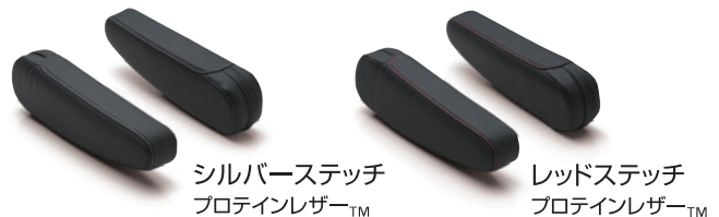
シルバーステッチ プロテインレザー™