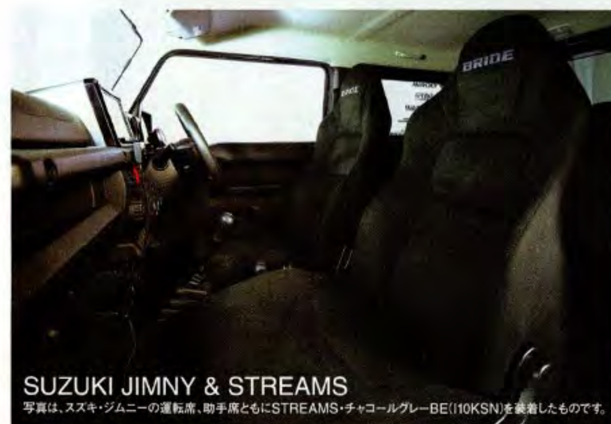
SUZUKI JIMNY & STREAMS

写真は、スズキ・ジムニーの運転席、助手席ともにSTREAMS・チャコールグレーBE(110KSN)を装着したものです。