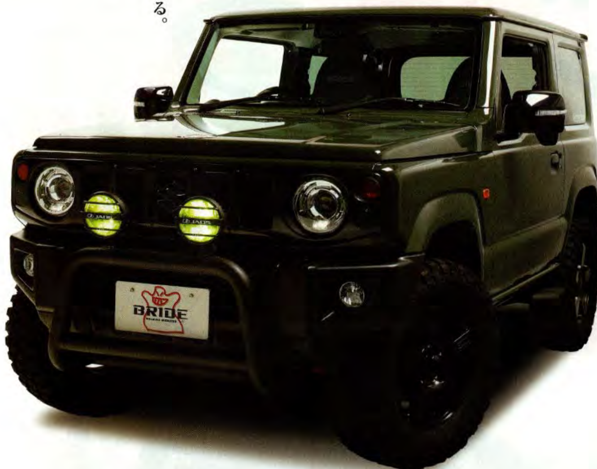
写真は、スズキ・ジムニーの運転席、助手席ともにZAOU・タフレザーブラック(L21TSR)を装着したものです。