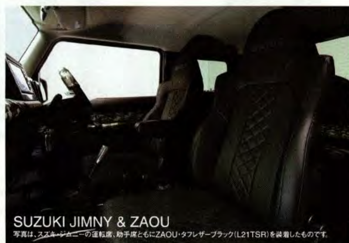
SUZUKI JIMNY & ZAOU

写真は、スズキ・ジムニーの運転席、助手席ともにSTREAMS・チャコールグレーBE(110KSN)を装着したものです。