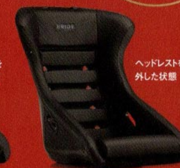
ヘッドレストを外した状態