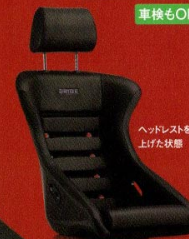
ヘッドレストを上げた状態