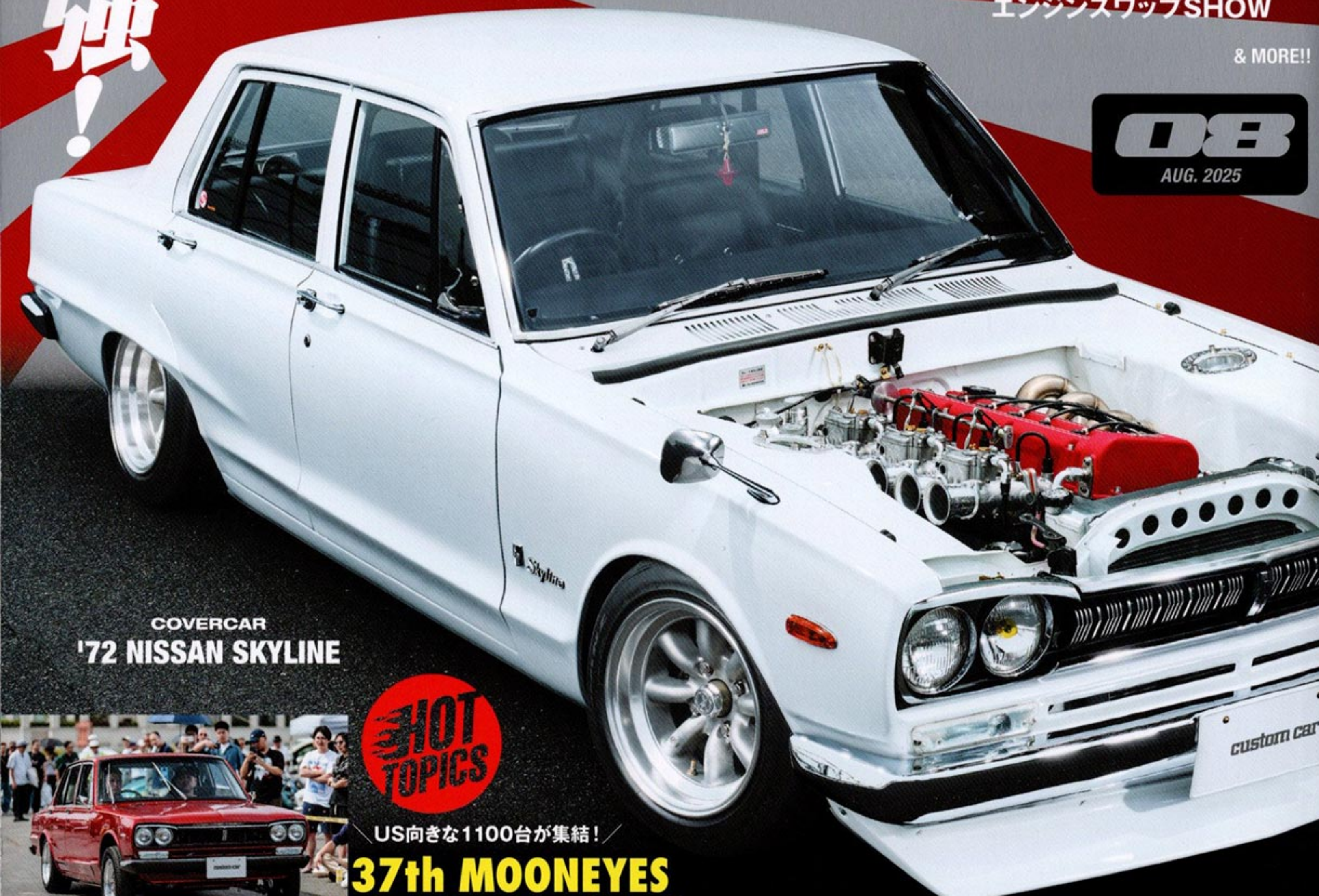
COVERCAR '72 NISSAN SKYLINE