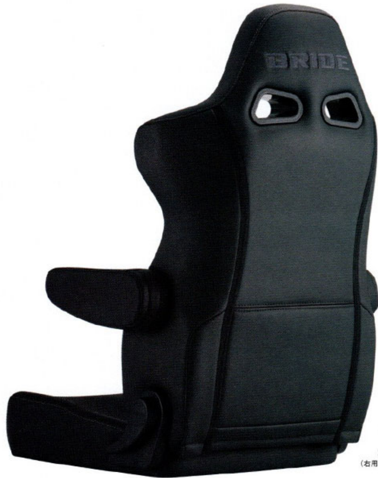
写真のモデルは、ERGOSTER・タフレザーブラック(E64TSR)+別売アームレスト・タフレザーブラック(右用:P51ARR、左用:P52ARR)です。

ユーロスターIIのスポーティーなデザインをベースに、室内空間の制約があるタイトな車種にも装着できるよう設計。ショルダー幅を抑えつつエッジを効かせたフォルムとウレタンの厚みを抑えサイドサポートを浅くしたフラットな座面を採用する。