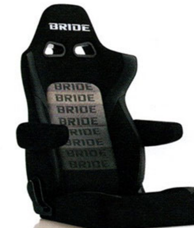
写真のモデルは、ERGOSTER・グラデーションロゴBE(E64GSN)+別売アームレスト・ブラックBE(右用:P51AAN、左用:P52AAN)です。