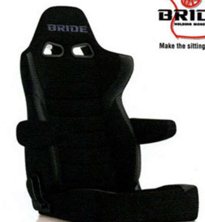
写真のモデルは、ERGOSTER・ブラックBE(E64ASN)+別売アームレスト・ブラックBE(右用:P51AAN、左用:P52AAN)です。