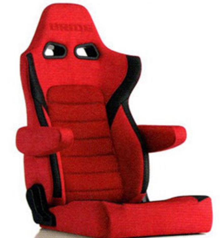
写真のモデルは、ERGOSTER・レッドBE(E64BSN)+別売アームレスト・レッドBE(右用:P51BBN、左用:P52BBN)です。

自然にフィットするボディーライン、ローポジション、フラット座面、エッジの効いたショルダー、全てをマイルドに仕上げ、心地良さを追求したスポーツモデル、エルゴスター。