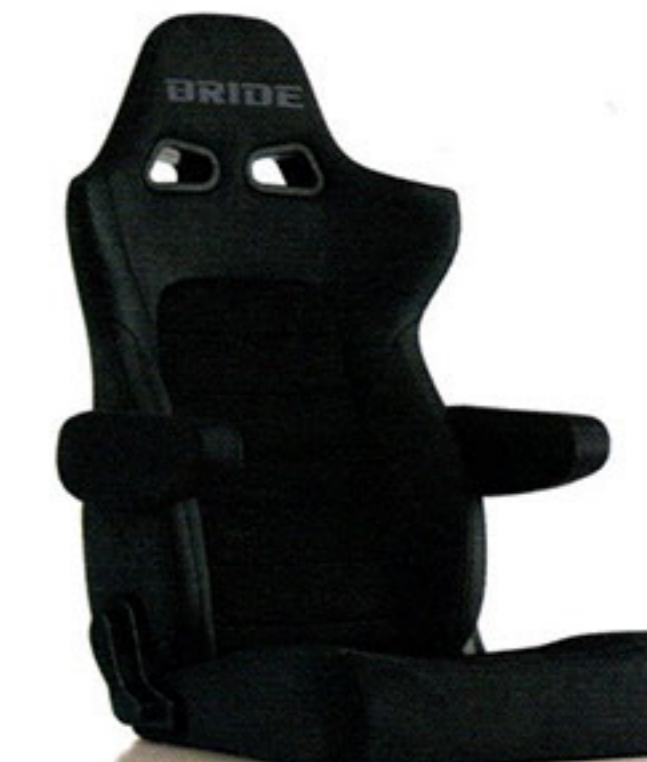
写真のモデルは、ERGOSTER・チャコールグレーBE(E64KSN)+別売アームレスト・チャコールグレーBE(右用:P51KKN、左用:P52KKN)です。