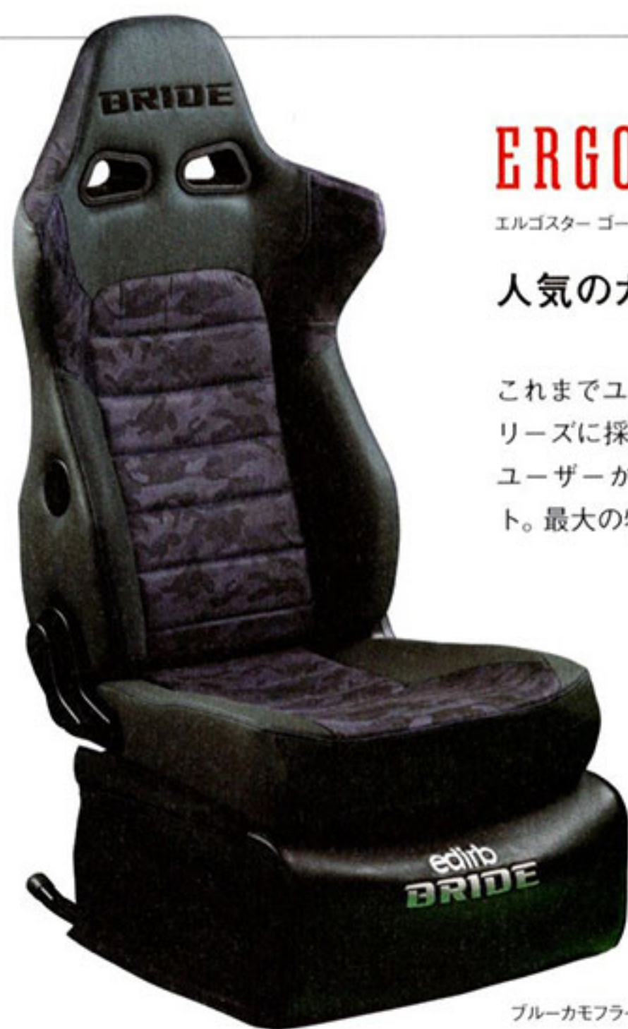
ブルーカモフラージュ

価格 16万6000円~17万9300円 カラー ブルーカモフラージュ、グリーンカモフラージュ