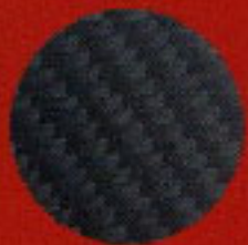
カーボン製シェル(CFRP)