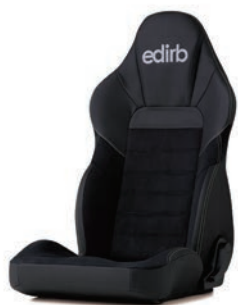
シルバーステッチ