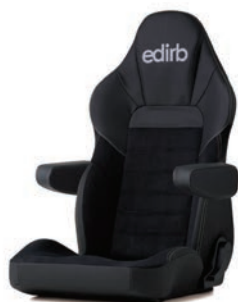
シルバーステッチ